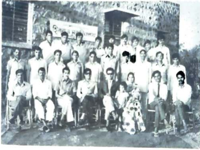
शिवराजचे वसतिगृह विद्यार्थी