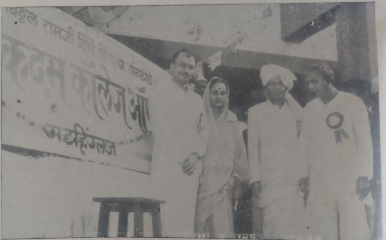
डॉ. एस. कदम विज्ञान महाविद्यालय नामफलक उद्घाटन