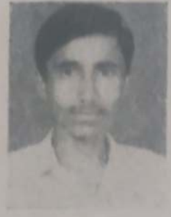
बागी एस. एस. बी. कॉम भाग २