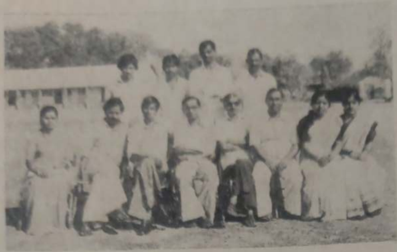
एम्. ए. भाग-२ समाजशास्त्र-अर्थशास्त्र