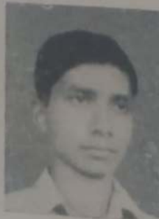
कोपाडे ए. ए. ११ वी कॉमर्स