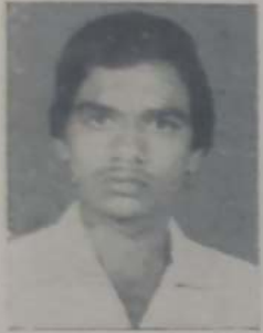
शहा पी. पी. बी.कॉम. भाग २