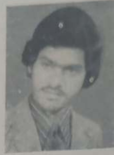
बोरनाक बी. आर बी.कॉम. भाग ३