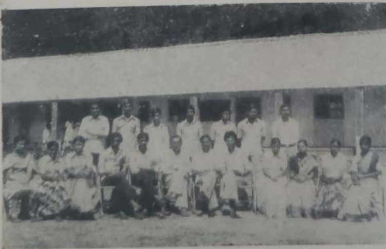
बी. ए. भाग-३ अर्थशास्त्र