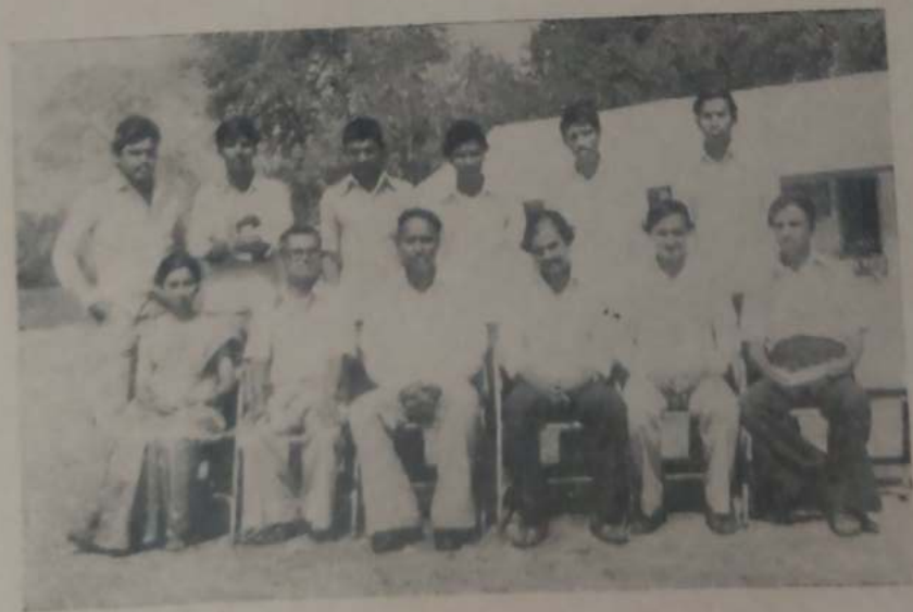
बी. ए. भाग-३ 'इंग्रजी'