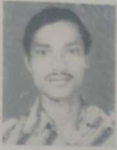
पट्टेकरी बी. डी. एम. ए. भाग १