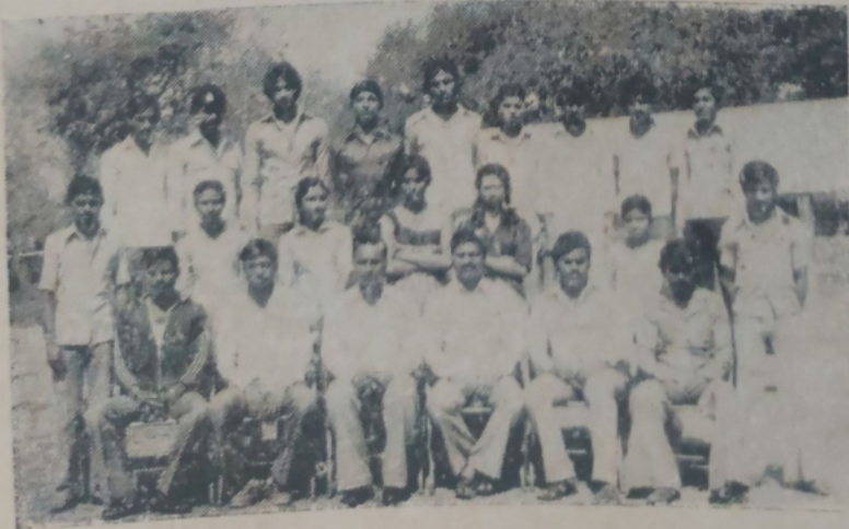
प्राचार्यासमवेत शिवराजचे खेळाडू