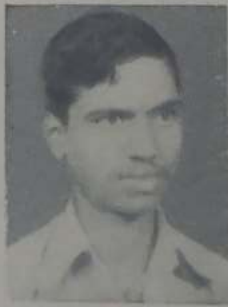
साळोखे जी. व्ही. १२ वी आर्ट्स