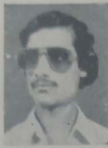
रोकडे एन. आय. बी. ए. भाग ३