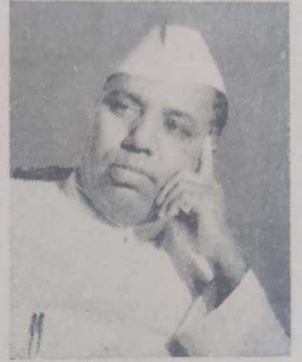
आधुनिक महाराष्ट्राचे शिल्पकार आणि आठव्या अर्थ आयोगाचे अध्यक्ष मा. यशवंतराव चव्हाण

• ॥ जन्म संपला येथला ॥ ॥ ऋण प्रेमाचे राहिले ॥ ॥ पुढे चालवा पालखी ॥ •