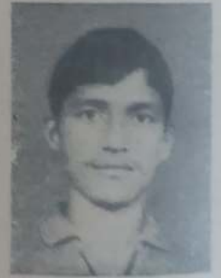
आसवले पी. एम. १२ वी आर्ट्स