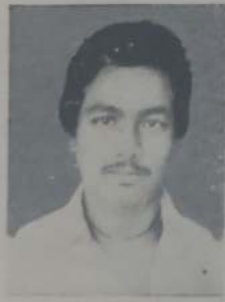
कुरणे व्ही. बी. बी.कॉम. भाग १