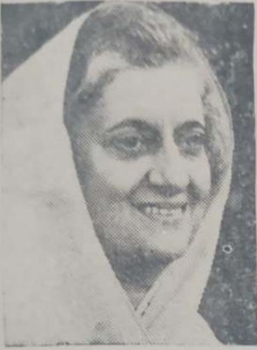
भारताच्या लाडक्या पंतप्रधान श्रीमती इंदिरा गांधी

• ॥ जन्म संपला येथला ॥ ॥ ऋण प्रेमाचे राहिले ॥ ॥ पुढे चालवा पालखी ॥ •