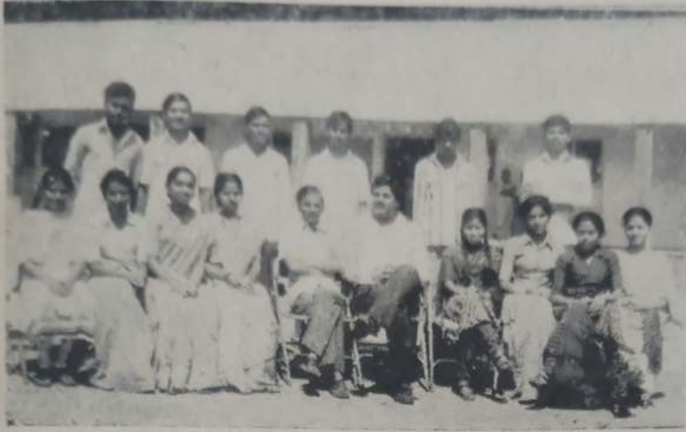
बी. ए. भाग ३ राज्यशास्त्र