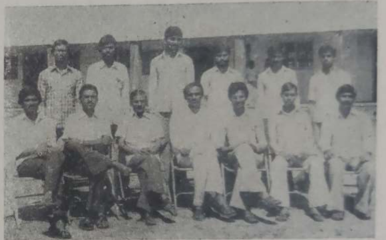
बी. ए. भाग ३ समाजशास्त्र