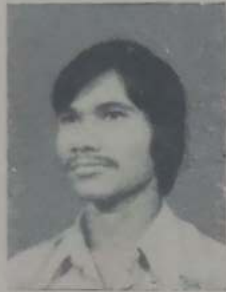
संकेश्वरी एम. एस. बी. ए. भाग २