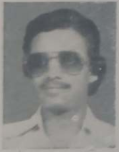
देसाई डी. जे. बी. ए. भाग १