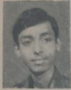
एल. डी. उपार बी. एस्सी भाग २