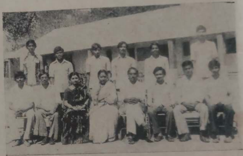
बी. ए. भाग-३ 'मराठी'