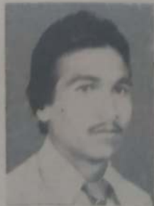
भालेकर डी. जी. ११ वी सायन्स